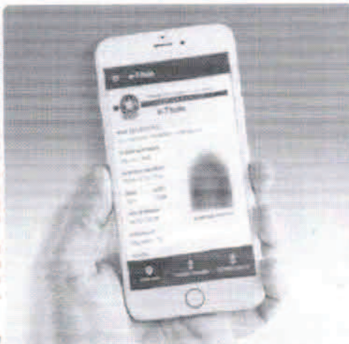
No dia de votação: Caso o eleitor não esteja em

Só pode emitir o e-Título e utilizá-lo para justificativa eleitoral quem está em situação regular na Justiça Eleitoral. Quem estiver com o título suspenso ou cancelado pode fazer a justificativa por outros meios, como as mesas receptoras de justificativa.